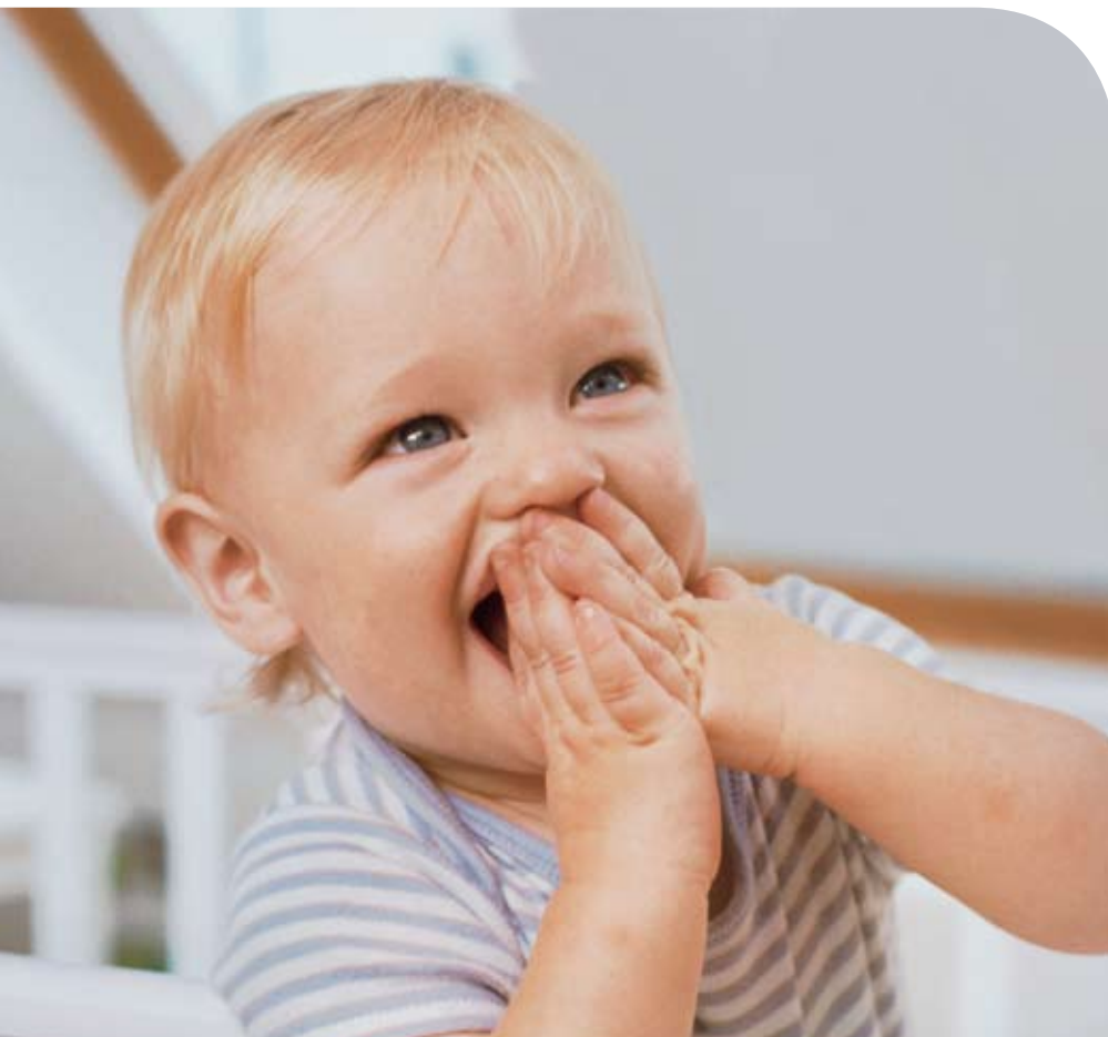
Het geluid van een giechelende baby

Goed horen. Het is niet altijd vanzelfsprekend. Maar wel belangrijk. Het helpt u om in contact te blijven met de wereld om u heen. Om te genieten van de mooie dingen in het leven. Alleen en met anderen. Daar kan Beter Horen u bij helpen. Vul de bon in. Dan brengen we samen geluid tot leven.